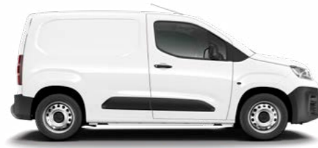
POLAR BLANCO (F)