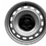
15 Y 16 PULGADAS LLANTA DE ACERO